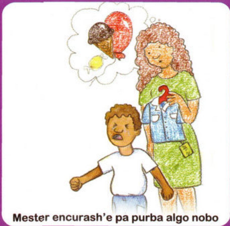
Mester encurash'e pa purba algo nobo